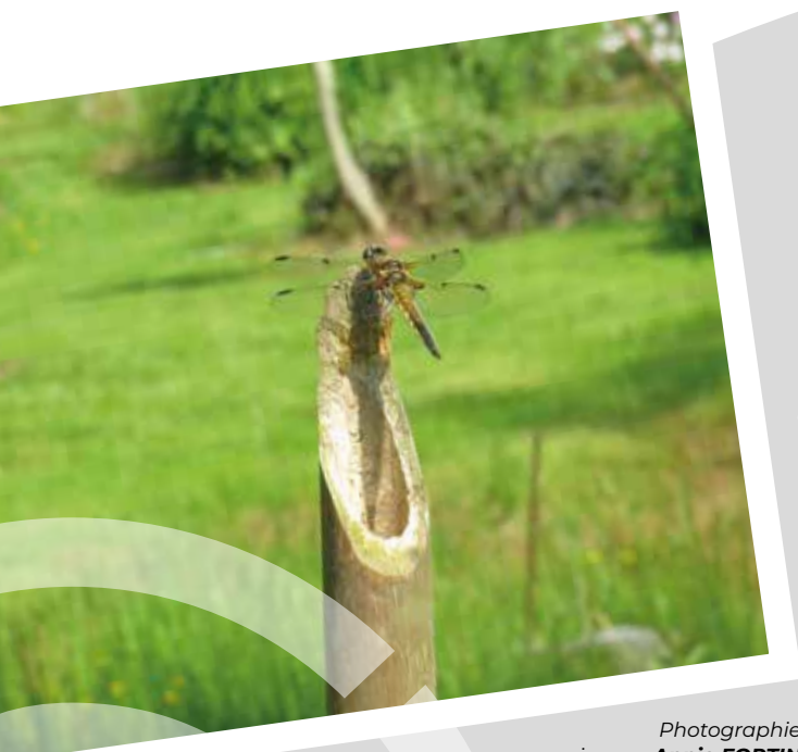
dans le village du Pas Français à La Flocellière

sur la commune déléguée de Saint-Michel-Mont-Mercure