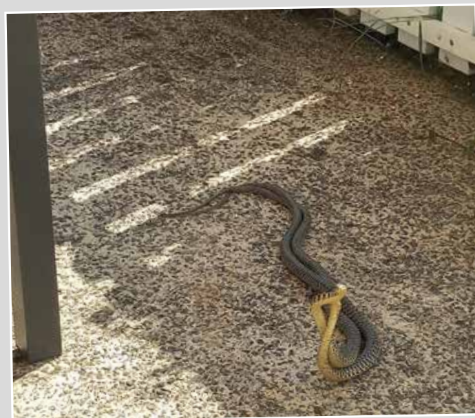
"LA FÊTE DES AMOURS POUR LES COULEUVRES" LE 20 JUIN Photographie prise par Michel POUPLIN sur la terrasse de son domicile à La Pommeraie-sur-Sèvre