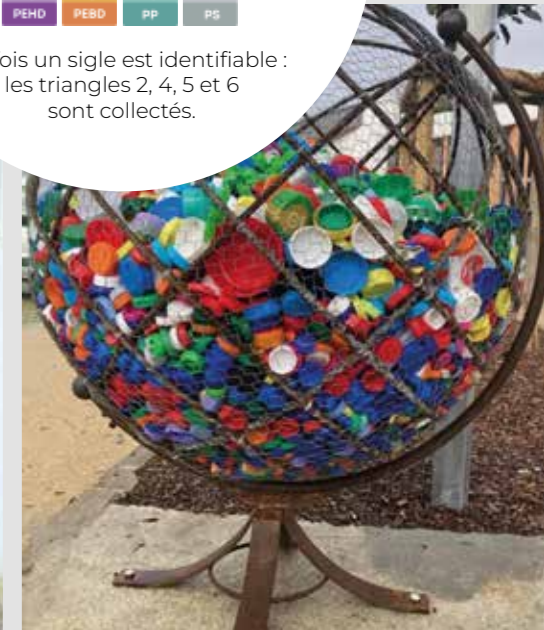
L'Atelier des Recycleurs Fous conçoit, fabrique et vend des machines pour transformer le plastique et sensibilise au recyclage

Maintenant qu'un grand nombre de bouchons a été collecté dans le globe installé sur la place du Commerce de La Flocellière, que va-t-on en faire ?