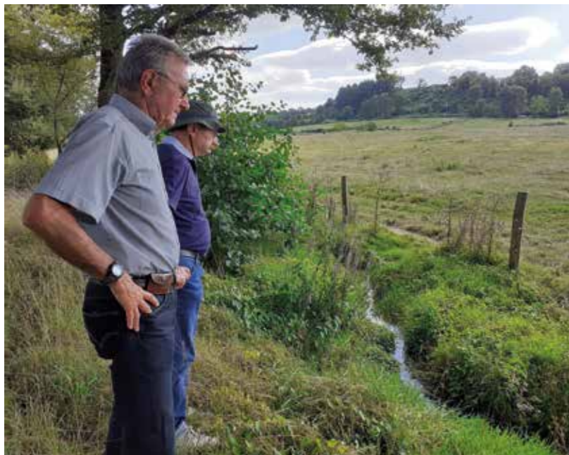
En tant qu' élu communautaire et membre du comité syndical de l'EPTB Sèvre Nantaise, lors d'une visite des cours d'eau en août 2023

En 1995, il prend une licence à l'ABV (Athlétisme Bocage Vendéen) de Pouzauges et en devient le président, il intègre aussi les Côtes Pouzaugaises qu'il dirigera en parallèle pendant une dizaine d'années. Grâce au dynamisme qu'il a su insuffler, les Côtes Pouzaugaises sont devenues un événement phare du Pays de Pouzauges.