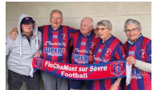
L'équipe de foot de l'EHPAD se prépare à la journée "Boîte à talents"

Le Projet Éducatif De Territoire (P.E.D.T.) 2023-2026 a été validé par le Service Départemental à la Jeunesse, à l'Engagement et aux Sports. Ce document structure les actions éducatives des 3 prochaines années autour de valeurs essentielles : le respect et la bienveillance, le bien-être et la santé, le cadre de vie et l'environnement, l'ouverture aux autres, le partage et la communication. C'est un projet conçu dans l'intérêt de l'enfant. En effet, la diversité des acteurs et des situations pédagogiques multiplient les possibilités pour les enfants de s'épanouir en acquérant différents savoirs, savoir-faire et savoir-être.