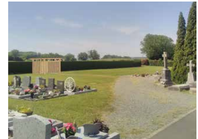
Projection - Intégration d'un espace couvert pour les cérémonies d'adieu au cimetière de Saint-Michel-Mont-Mercure

Budget Participatif : la création d'un espace couvert pour les cérémonies d'adieu au cimetière de Saint-Michel-Mont-Mercure. Au cours de l'hiver, le conseil municipal a autorisé, dans le respect du règlement, d'augmenter l'enveloppe financière de ce projet sans toutefois dépasser un budget total de 30 000 €. En effet, compte-tenu de la symbolique du lieu, les membres du collectif de pilotage ont proposé d'utiliser plutôt des matériaux naturels et locaux, notamment pour ce qui concerne l'ossature et le bardage en bois de châtaignier issu du Pays de Pouzauges, afin d'insérer au mieux cet espace couvert dans l'enceinte funéraire.