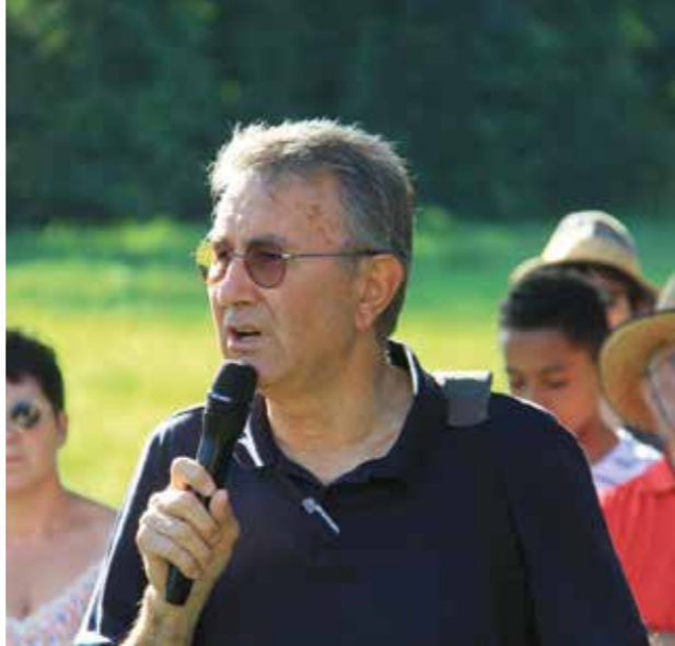
Balade estivale à La Pommeraie-sur-Sèvre le 19 juillet 2021