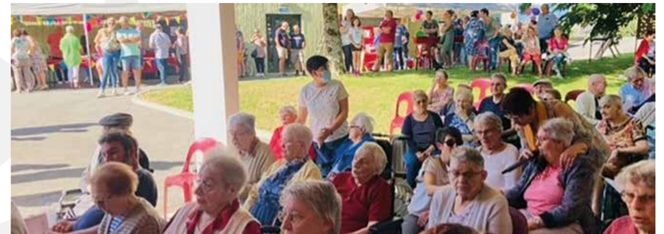
Fête de l'EHPAD, le samedi 30 septembre