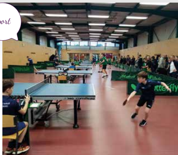
Reprise du championnat jeunes avec beaucoup de public, le samedi 11 novembre 2023 au complexe sportif du Mont Mercure

Si vous souhaitez intégrer le club pour la compétition ou uniquement le loisir, n'hésitez pas à nous contacter.