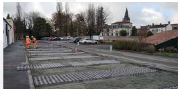
Pour lutter contre les îlots de chaleur urbains, le revêtement du parking situé devant l'institut de beauté et le salon de coiffure, prévu initialement en enrobé, a été en partie végétalisé à l'aide d'alvéoles qui permettent une infiltration naturelle de eaux de pluie et qui seront engazonnées.