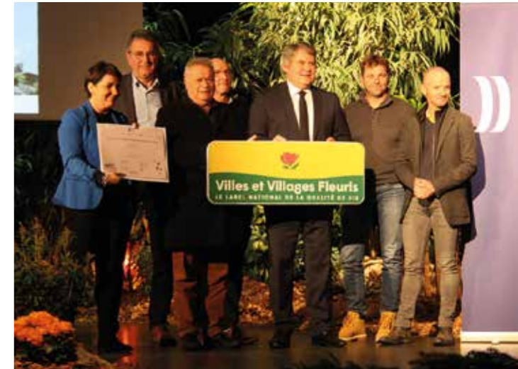
Remise de la 1 ère fleur au concours Villes et Villages Fleuris le 29 novembre 2022