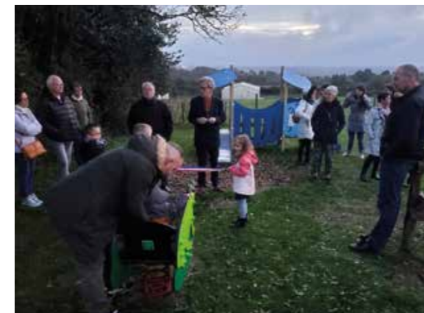
Inauguration de l'aire de jeux rue de la Garenne à Saint-Michel-Mont-Mercure, vendredi 3 novembre

Inaugurée en novembre 2023 sur la commune déléguée de Saint-Michel-Mont-Mercure, l'aire de jeux pour les enfants de 6 mois à 6 ans, proposée par les assistantes maternelles de la commune sera bientôt rejointe par une nouvelle réalisation validée à l'issue de la première campagne du