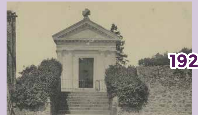
La Flocellière Ce monument aux morts a une histoire originale. Construit comme chapelle mortuaire de la famille ALQUIER dans le parc du château, l'édifice fut déplacé en 1921 à l'entrée du cimetière pour édifier un monument en l'honneur des poilus floccéens. C'est l'un des rares monuments aux morts de type religieux.