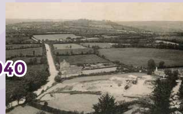
Saint-Michel-Mont-Mercure Vue panoramique vers "la colline des Justices", direction Les Herbiers. À l'époque, le site des Alouettes était plus renommé et considéré (à tort) comme le point culminant de la Vendée. On voit en bas à droite le site de la carrière en exploitation et le nouveau cimetière. On voit aussi au centre les bâtiments dits "Les Tuileries".