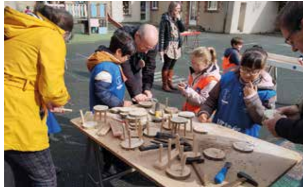
Atelier de menuiserie

D'autre part, nous avons poursuivi notre collaboration avec la résidence autonomie avec qui nous avons organisé des rencontres à l'école ou sur leur site, ce fût l'occasion de jardiner, de partager des moments de classe en extérieur... des moments riches pour tous. La fin d'année a aussi été marquée par notre sortie scolaire au Futuroscope qui a été l'occasion, en lien avec notre projet, de travailler sur les métiers du futur. Et que serait une fin d'année scolaire sans la traditionnelle kermesse qui a remporté un franc succès. L'Ogec a présenté sa capsule temporelle où chacun avait au préalable été invité à y déposer un souvenir d'école. La capsule sera déposée sous terre et réouverte dans 15 ans. Le rdv est donc pris en 2039 !