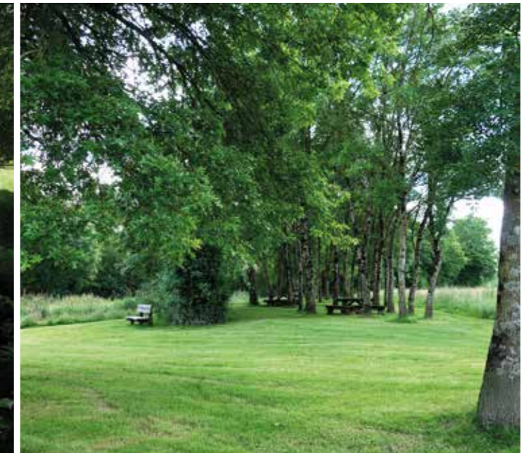
Les bords de Sèvre / La Pommeraie-sur-Sèvre