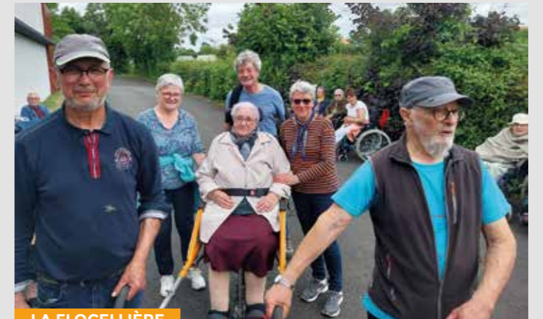
Journée Bol d'Air