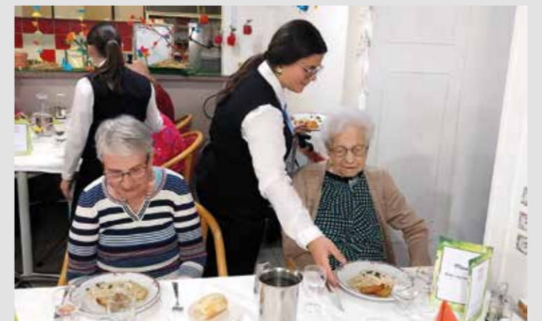
Le restaurant est venu à l'EHPAD