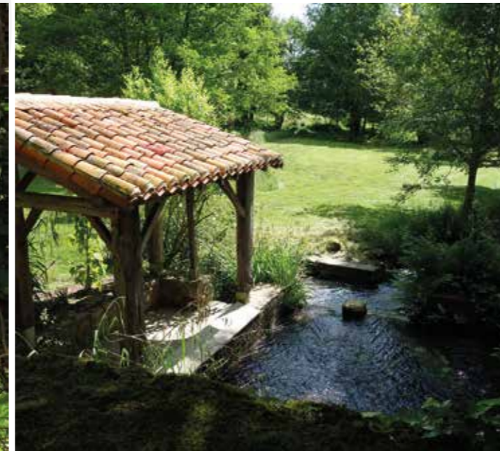
Le parc des Lavandières / Les Châtelliers-Châteaumur