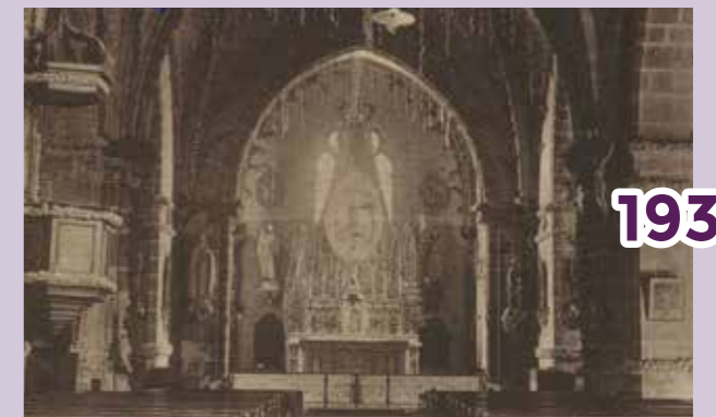
La Pommeraie-sur-Sèvre Intérieur de l'église décoré