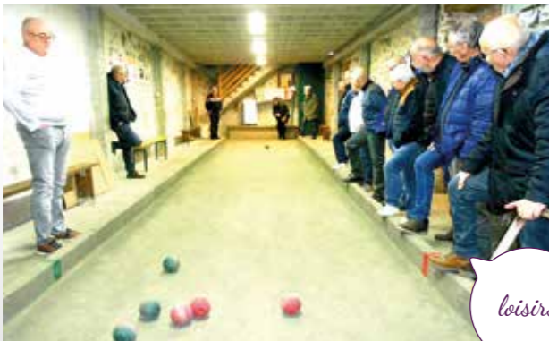
Les joueurs de boules

Fort de ses 170 adhérents, le club se porte bien !