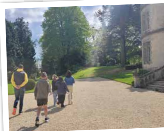
Chasse au trésor au château de La Flocellière