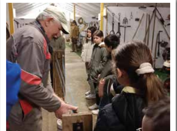
Découverte des savoir-faire d'autrefois