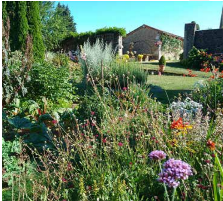
Le jardin des Carmes / La Flocellière

Plus ou moins cachés, la commune de Sèvremont regorge de jardins publics ou privés, qui s'ouvrent au regard des visiteurs pendant l'été ou tout au long de l'année.