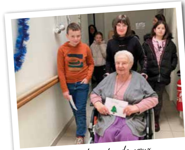
Remise de cartes de vœux créées pour les résidents de l'Ehpad et de la résidence autonomie

Ce dispositif encourage les élèves de CM2 à mener des actions citoyennes et civiques, sur le temps scolaire ou personnel. La commune de Sèvremont le propose depuis la rentrée scolaire 2021.