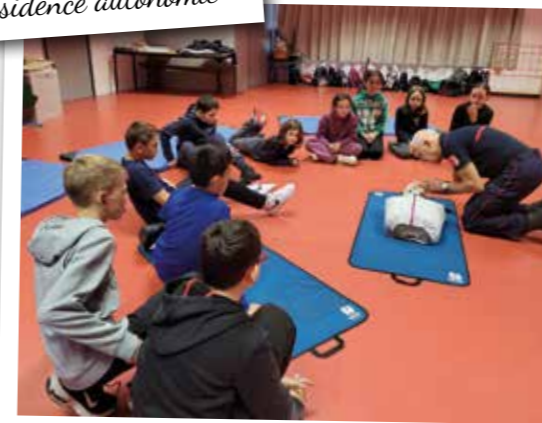
Apprentissage des gestes de premiers secours