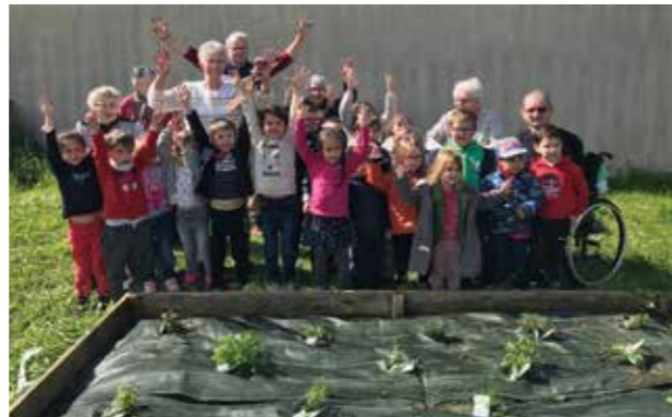
Jardinage avec les résidents