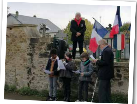
Commémoration du 8 mai et du 11 novembre