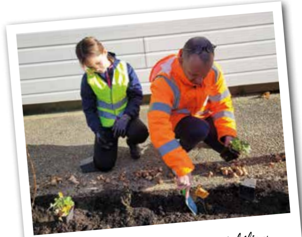
Plantations pour désimperméabiliser les sols à Saint-Michel-Mont-Mercure