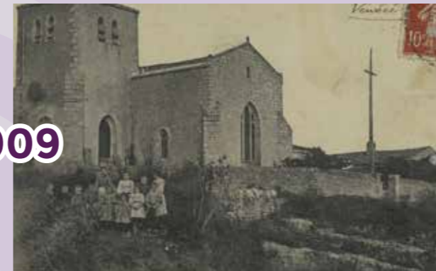
Les Châtelliers-Châteaumur Église